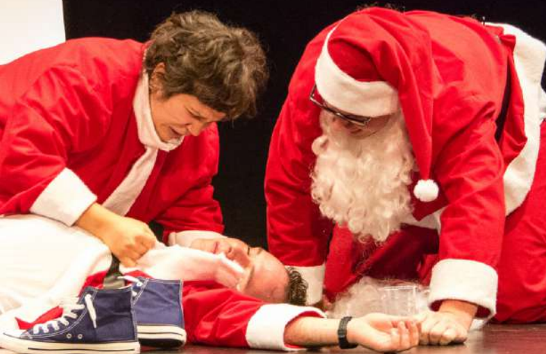
Sobre el fenómeno de los trabajos de mierda