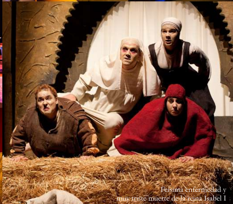
Feísima enfermedad y muy triste muerte de la reina Isabel I